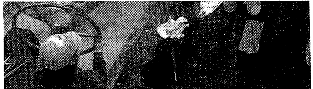
田島軽金属は大型アルミ鋳物の技術を磨き、企業と取引を始め、飛躍のきっかけをつか