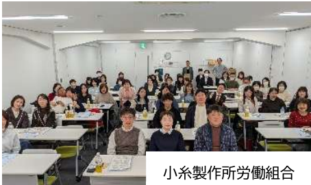
小糸製作所労働組合