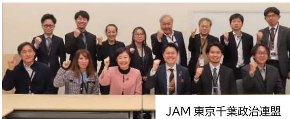
JAM 東京千葉政治連盟