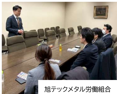
旭テックメタル労働組合