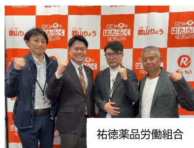
祐徳薬品労働組合