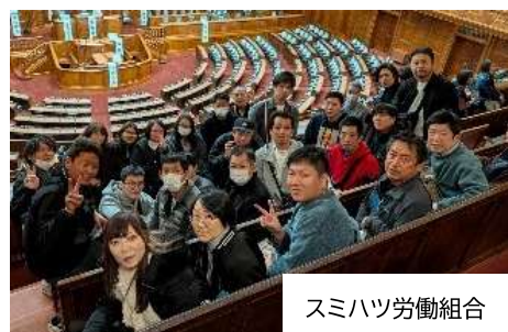
スミハツ労働組合