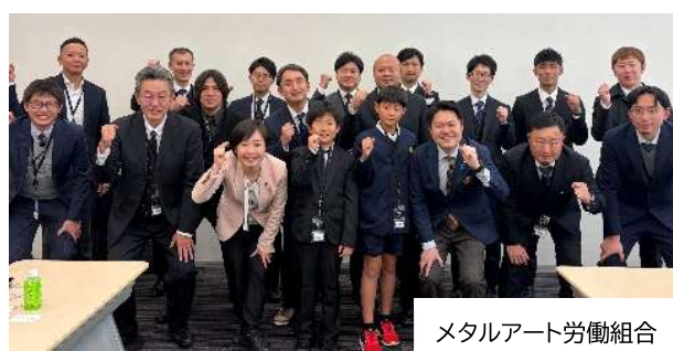
メタルアート労働組合