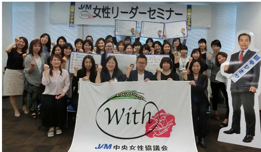
働く「みんな」は働く「わたし」へ 伝道師として地方・単組へ展開することを確認

With（JAM中央女性協議会）は、「2018年女性リーダーセミナー」を5月18日～2日間東京・友愛会館で開催した。「私たちが考えるTANA会」として、組織内議員の必要性や政策課題を自分事として捉える意識づけを図った。参加は6地方32単組35人。