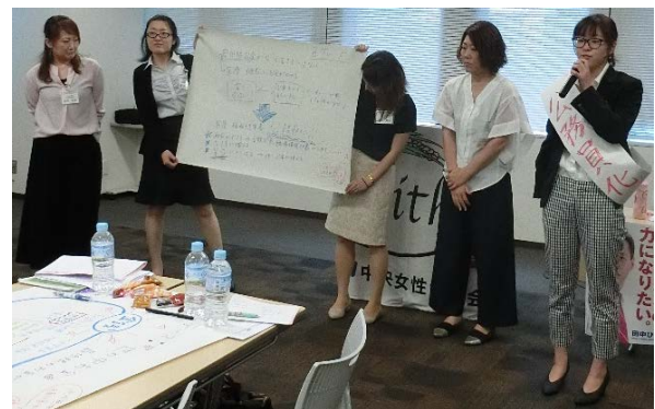
政策を掲げたタスキをかけ、自分たちの考えを訴えた

男女の格差：賃金、手当、役割分担意識 等 収入の格差：正規・非正規、学歴、職種 等 地域の格差：公共施設の数や質、交通の便 等